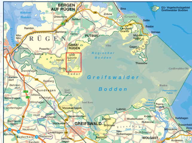
EU-Vogelschutzgebiet, „Greifswalder Bodden und südlicher Strelasund“

Bei einer Beweidung mit Rindern, Pferden oder Schafen kann sich eine kurzgrasige Salzweide entwickeln, die ein wichtiger Lebensraum für viele spezialisierte Vogelarten ist. Enten, Gänse und Watvögel ziehen in den Salzweiden ihre Jungen auf. Noch sind die Rufe der Rotschenkel an der Schoritzer Wiek regelmäßig zu hören. Aber auch hier ist die Zahl der brütenden Küstenvögel, wie auch in anderen Küstenregionen, rückläufig. Wesentliche Gründe für diese Entwicklung sind eine veränderte Landnutzung und die hohe Dichte an räuberischen Wildtieren, wie Fuchs und Mink.