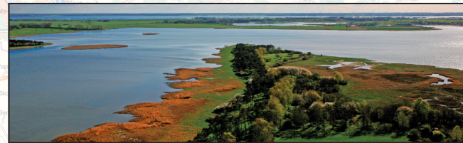
Schoritzer Wiek mit Silmenitzer Heide, Heidekaten, Maltziener Wiek und Strelasund im Hintergrund

Die Schoritzer Wiek ist Teil des EU-Vogelschutzgebietes „Greifswalder Bodden und südlicher Strelasund“ und des FFH-Gebietes „Greifswalder Bodden, Teile des Strelasundes und Nordspitze Usedom“. Bereits 1937 wurden Teile der Schoritzer Wiek als Naturschutzgebiet (NSG) ausgewiesen. Nach zwischenzeitlicher Löschung erfolgte 1981 eine Neuausweisung mit der heutigen Abgrenzung (siehe Karten).